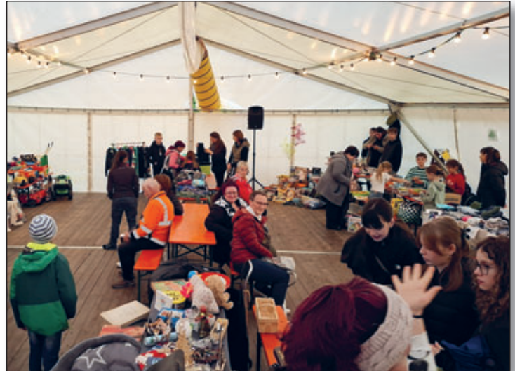
Erstmals zur Kirmes wurde ein Flohmarkt durchgeführt. Insgesamt 27 Stände boten ihre Ware feil. Das Besucherinteresse hätte allerdings noch etwas größer sein können.