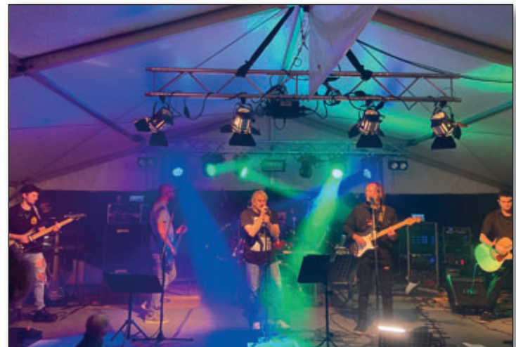
Während am Samstagnachmittag die Würschnitzaler Musikanten die Gäste unterhielten, spielte abends die Rockband „Change“ zum Kirmestanz auf.