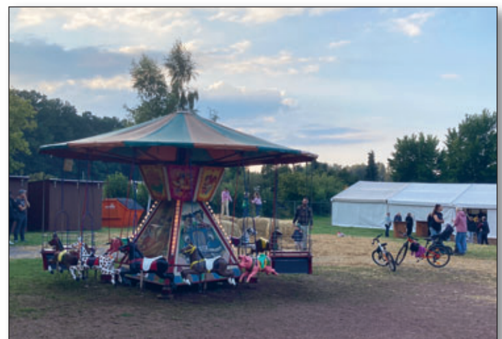
Schießbude, Kinderkarussell und Strohhüpfburg ergänzten das Kirmesangebot. Hinzu kamen noch Händler und Vereine für Speisen und Getränke.